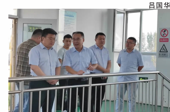
城郊水務检查现场