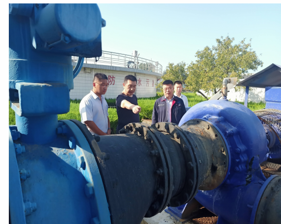
▲ 新水河污水检查现场