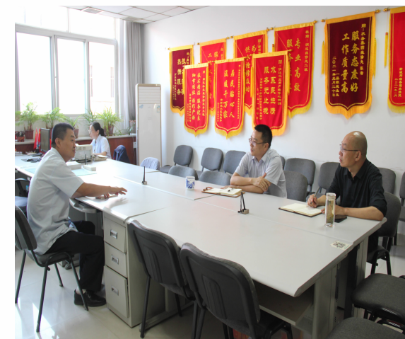
▲ 润达水业用户服务处调研现场