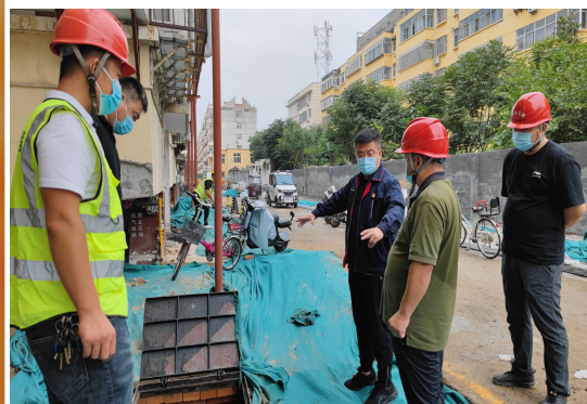
水兴市政工程施工检查现场

本报讯 为进一步落实企业安全生产主体责任,推进集团环境安全管理和有限空间作业管控,9月2日,集团党委副书记、董事、总经理王吾雪带队,先后到水兴市政工程施工现场、新水河污水开展安全环保和有限空间作业专项检查。 在水兴市政老旧小区自来水“一户一表、计量出户”施工现场,王吾雪听取了现场负责同志对施工现场安全环保措施的介绍,仔细查看了施工现场对扬尘的治理、噪声污染的控制、固废的处置、劳动